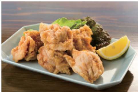
ミナミ田園からあげ 748円