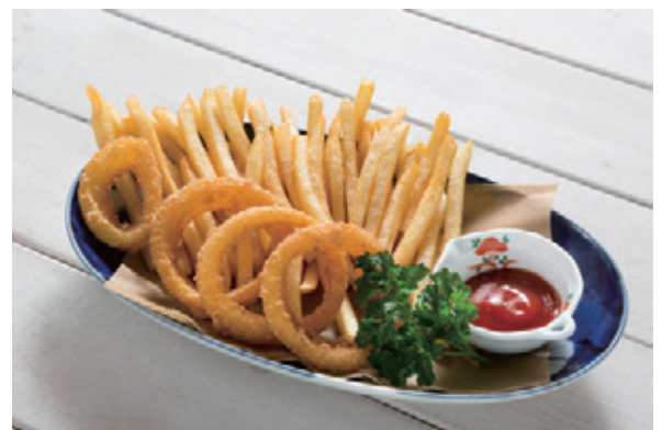
オニオンリング & フライドポテト 550円