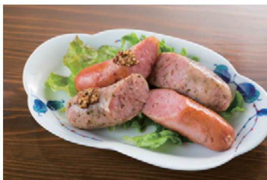
2種のソーセージ (プレーン&バジル) 748円